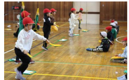
なわとびトライの様子

11月から体力作りとして、週に1度「なわとびトライ」が行われていました。内容は、1分間に前回し跳びで何回跳べるかを2人1組になって数え合い、記録します。着実に跳ぶ回数が増えています。継続は力なり。冬休み中も体力づくりになわとびに挑戦してみたいかたがででしょうか。