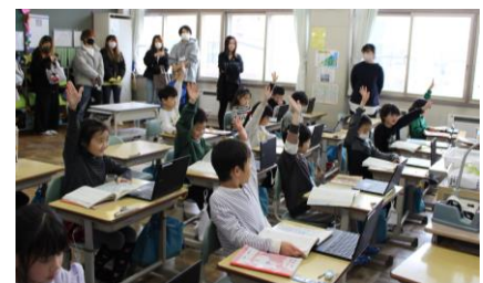
1年生 授業参観の様子

個人懇談会では、短い時間でしたが、お子さんの成長やこれからがんばってほしいことなどについて、お話しすることができました。お忙しい中、お時間を作っていただきありがとうございました。また、授業参観では、お家の方に見ていただけただけで、子ども達は、緊張しているようでした。お家の方に、学校でのお子さんの様子を知っていただく良い機会になりました。