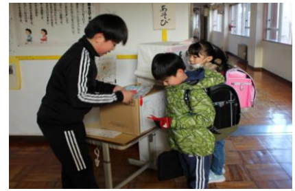
赤い羽根募金の様子

先日、児童会活動の1つとして、赤い羽根募金活動がありました。貯金箱を持ってきた子どもが児童会の役員に手渡し、代わりに赤い羽根をもらいました。子ども達の善意である募金は、この地域のために使われるそうです。ご協力ありがとうございました。