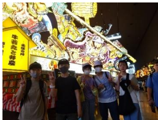
←ねぶたの前でピース

こまをみんなに見せようと思った時、手が滑って緑の着色料の入っているお皿にコマがドボン！！頑張ったのに全ての努力が水の泡になって泣きそうになりました。しかしコマを回すと結構きれいで嬉しくなりました。失敗したことも修学旅行の思い出になると思いました。(N S)